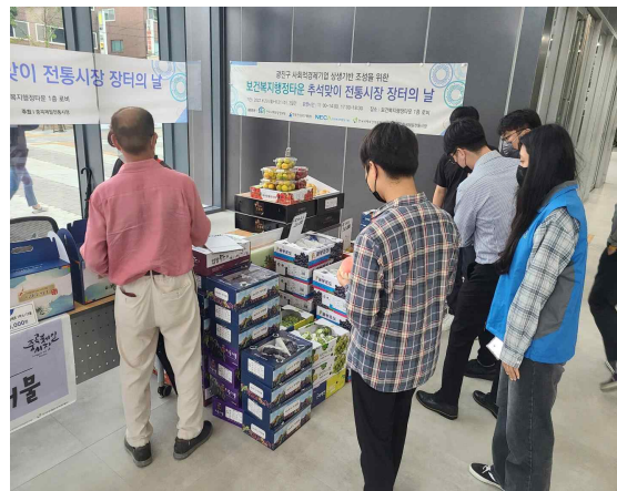
[보건복지행정타운 공공기관 임직원 및 지역주민이 추석맞이 장터를 방문하여 추석선물을 구경하고 상품에 대한 설명을 듣고 있다.]