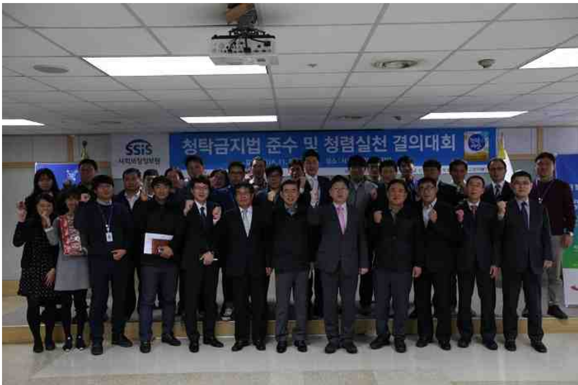
사회보장정보원은 11일 임직원을 대상으로 청렴실천 결의대회를 개최했다.